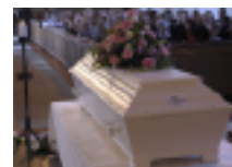
• Familj och vänner tog ett sista farväl av Engla • Läs artiklarna om mordet på Engla Juncosa Höglund