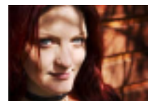
• Hennes tid som strippa blev en bok