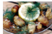
• Försmak av sommaren